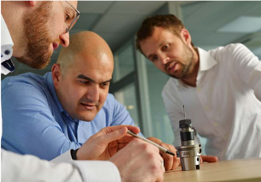
4 Wie soll die optimale Spanntechnik bei dieser Gewindefertigungslösung für die Raumfahrt aussehen? Diese und andere Fragen werden beim Werkzeughersteller im Team beantwortet

koeffizient damit erhöht. Im Einsatz hat das den Vorteil, dass man axiales Verschneiden vermeidet, die Oberfläche der Gewindeflanken bei angepasster Geometrie aber dennoch die Ansprüche erfüllt. Zusätzlich wird für den konventionellen Einsatz die Anschnittlänge erhöht, die zu erfolgende Zerspanung damit also auf mehr Gewindegänge verteilt.